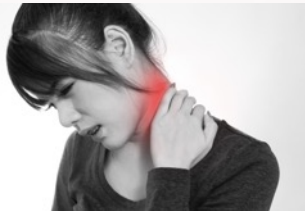
●首の後ろ側が常に張っていて痛い方

チラシをお持ちいただいた方限定！ 【無料】骨盤の歪み矯正 5,200円 ▶ 980円