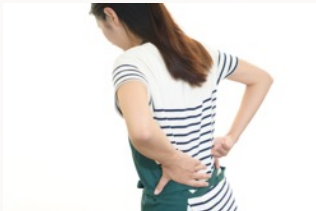
●腰が痛くて立ち仕事がつらい…